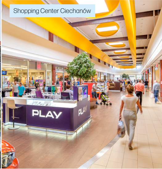
Shopping Center Ciechanów