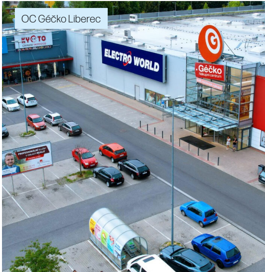
OC Gěčko Liberec