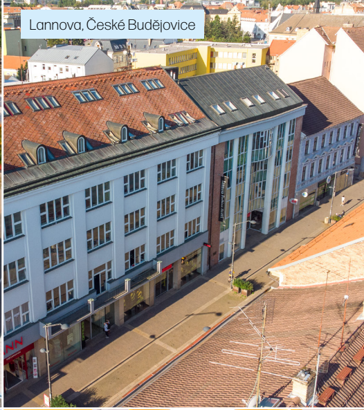
Lannova, České Budějovice