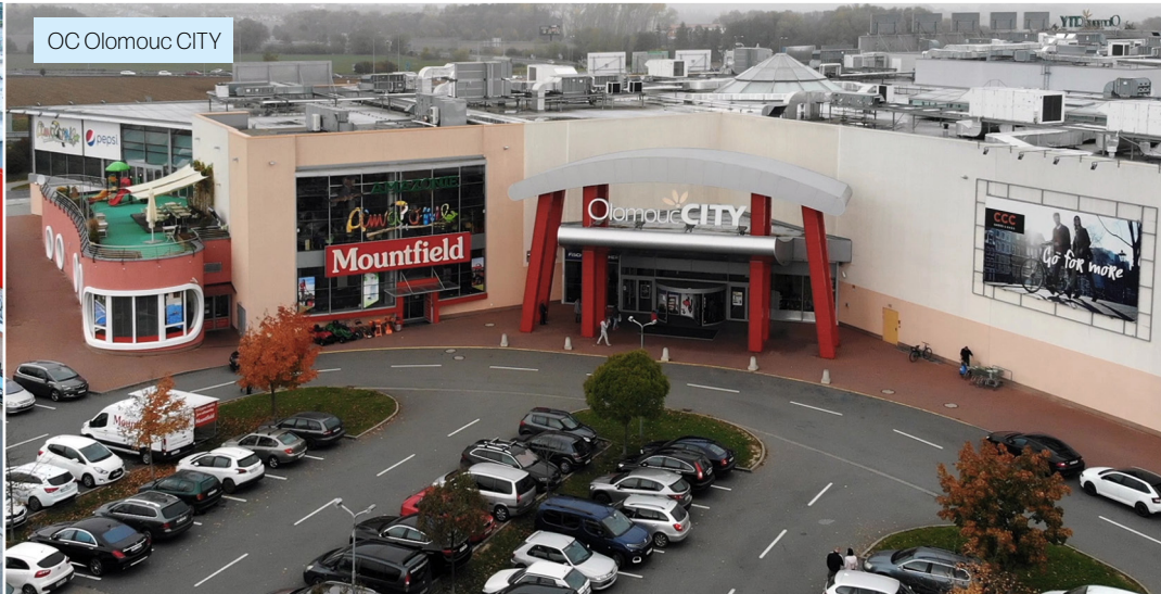
OC Olomouc CITY