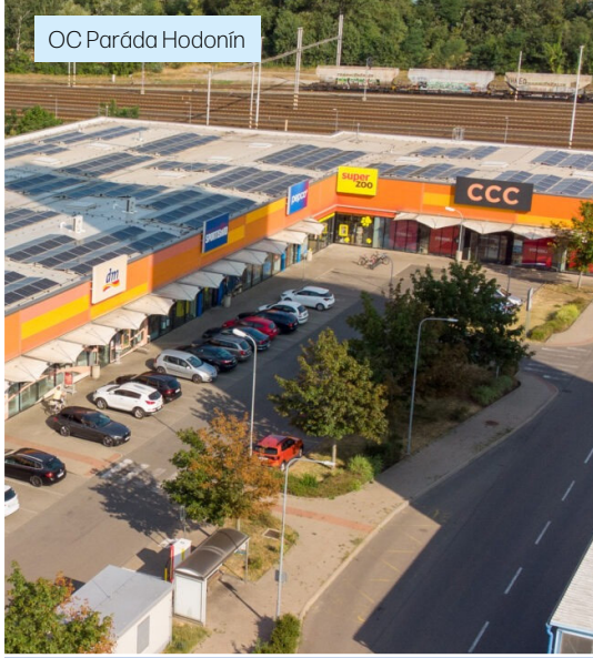
OC Paráda Hodonín