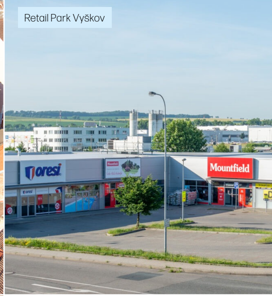
Retail Park Vyškov