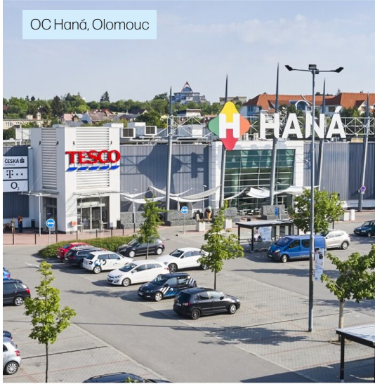
OC Haná, Olomouc