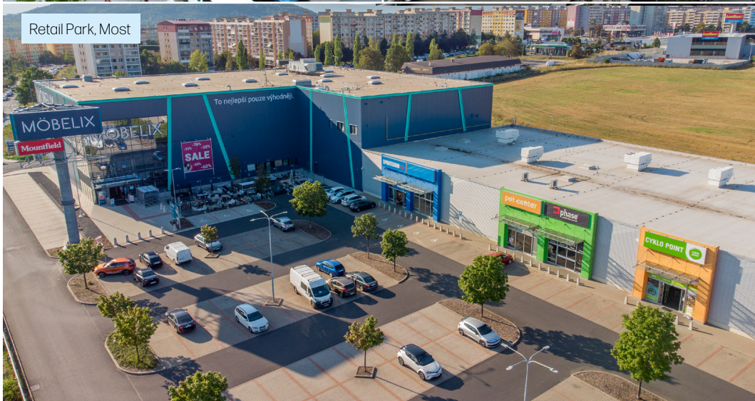
Retail Park, Most