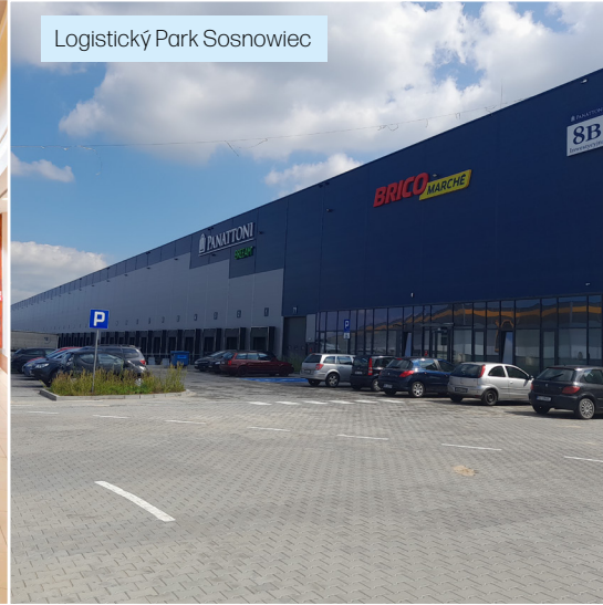
Logistický Park Sosnowiec