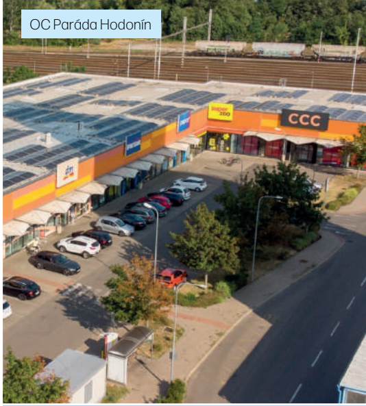
OC Paráda Hodonín