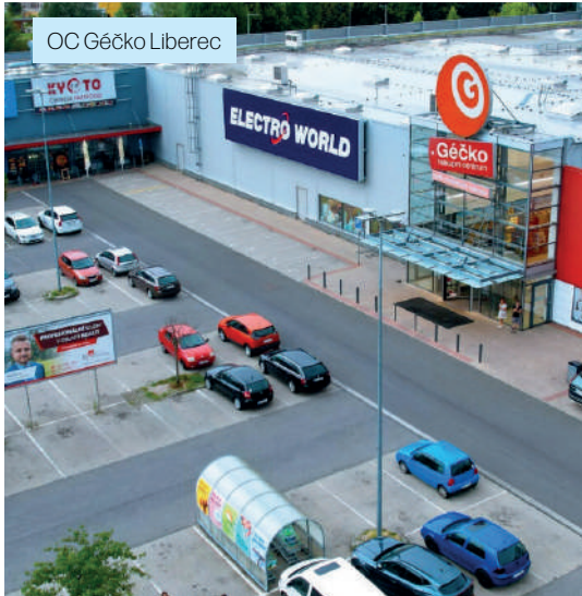
OC Gěčko Liberec