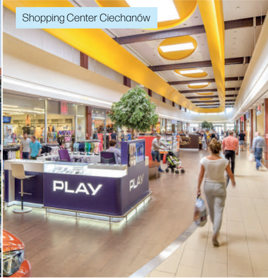
Shopping Center Ciechanów