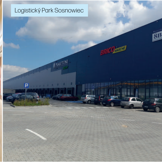
Logistický Park Sosnowiec